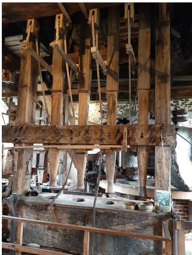
Zo staan alle vier de stampers vast in de hoogste stand.