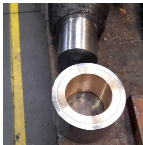
Onderste gedeelte van het kroonijzer met de gehard stalen taats. Mooi afgedraaid. Taatspot met daar in de brick.

Onder in de koningsspil is een kroonijzer gestoken, met daarin een gehard stalen taats, die in de taatspot draait. De taatspot bestaat uit een gietijzeren bak, waarin een tweede bakje van hardstaal met lood is vastgegoten. In dit tweede bakje is een bij de taats passend rond gat uitgespaard. dit gat is voorzien van een bronzen bekleding. Onder in dit gat ligt een hardstalen plaatje, het tegeltje (of brick), waarop de bol afgewerkte taats van de spil draait. Ook het tegeltje is aan de bovenzijde bol voor zo min mogelijke wrijving in de taatspot.