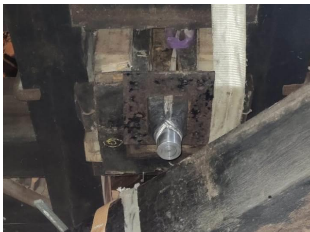
De plek in de draagbalk waar het gietijzeren met de taats in komt.